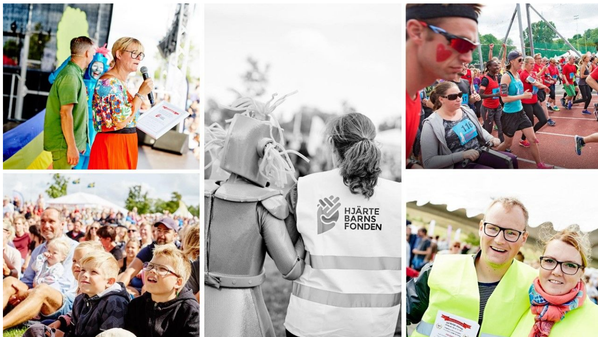
Engagemang för Hjärtebarnsfonden

Under 2018 har intrimning skett av de nyttillskott som implementerades året innan. Det nya CRM-systemet ger möjlighet till djupare analys av olika intäktskällor, givarbeteenden och trender och ger därmed fördelar både när det gäller att få fler givare och medlemmar, samt även nå ut till Hjärtebarnsfondens övriga intressenter på ett mer engagerande sätt.