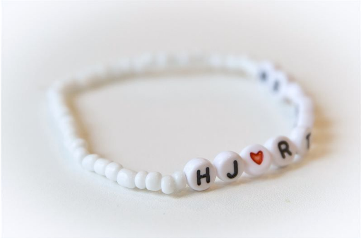
Hjärtebarnsfondens populära och mycket uppskattade armband.

Ur Rapport Utvecklingsbidrag "...Det viktiga budskapet är samarbetet mellan olika professioner. I London har de speciella transplantationsmottagningar och en sjuksköterska berättade om sina erfarenheter.